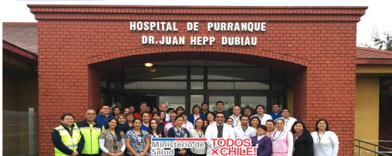
Hospital Dr. Juan Hepp Dubiau de Purranque